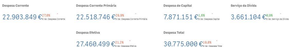
Figura 2 – Principais agregadores da despesa