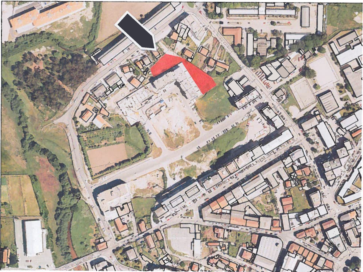
Zona destinada a futuro estacionamento

Estão em curso contactos, quase definitivos, tendo em vista a compensação com estacionamento gratuita para aproximadamente 130 viaturas.